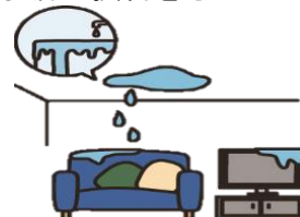
過去の支払例 350万円

保険に入っていない場合、 事故によっては、多額の費用を請求される事があります。 ※ 実際に自己負担で支払っている方がいらっしゃいます！