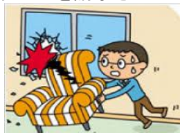
過去の支払例 130万円