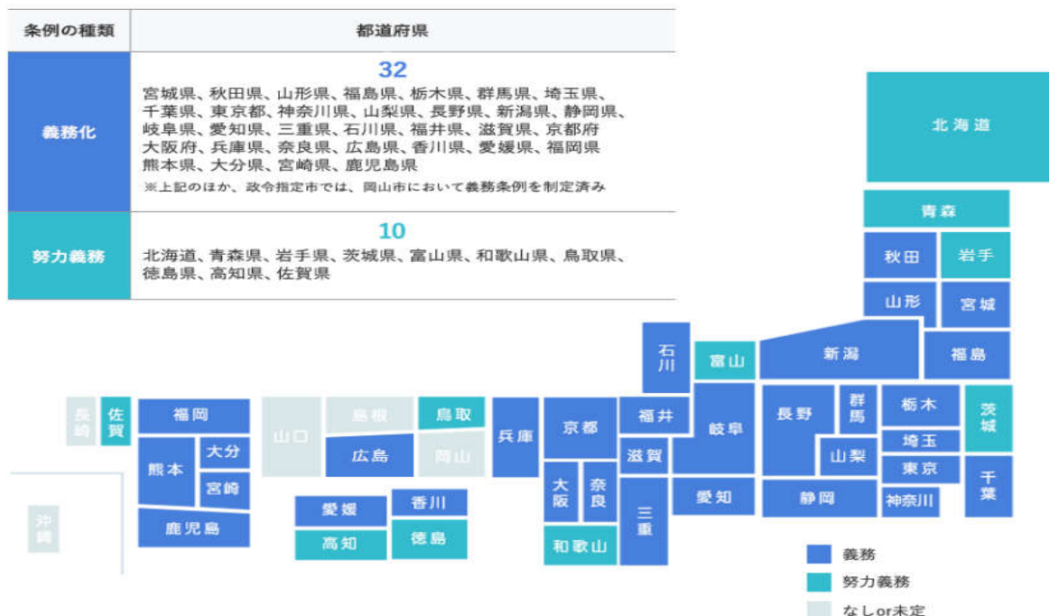
地方公共団体の条例の制定状況(令和5年4月1日現在)