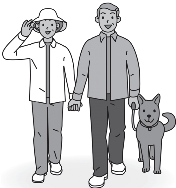
(団体割引20%*1、優良割引5%適用*2) 割増引の概要については*1*2をご覧ください。

補償内容等の改定を行っています。更新に際し、改定後の内容にてご案内しますので、必ず本パンフレットならびに別紙「改定のご案内」をご確認ください。