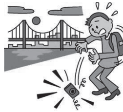
カメラを落とした