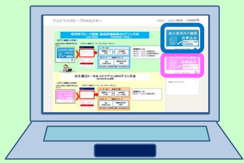
※画面はイメージです。実際のものとは異なる場合があります。