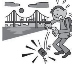
カメラを落とした