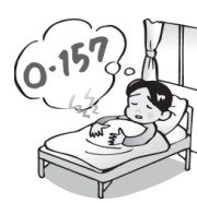
O-157に感染し入院 した。