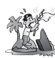
旅行中に遭難した 場合の救援者費用