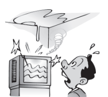
水漏れを起こし階下の 住民に損害を与えた。