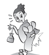
レンタル業者から借り た着物をカギざされた。