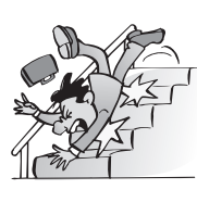
階段を踏み外し ケガをして通院した。