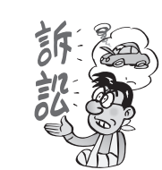
交通事故にあったと きの賠償請求費用