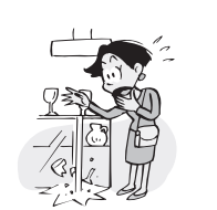
買い物中に誤って 商品をこわした。