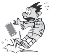
携帯電話をうっかり 落としてこわした。