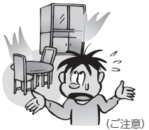
(ご注意) 火災により家財が 焼失した。