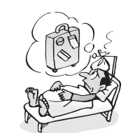
病気で入院し中止した海 外旅行のキャンセル費用