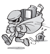
泥棒が入り家財が盗 難の被害にあった。